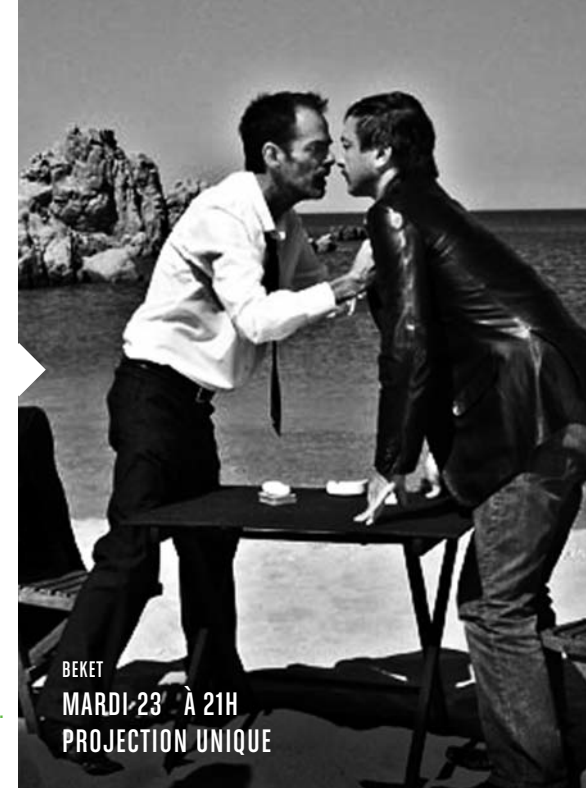
BEKET MARDI 23 À 21H PROJECTION UNIQUE

Une esthétique à la Wenders, des dialogues percutants, des situations ubuesques : une fable complètement déjantée et décalée.