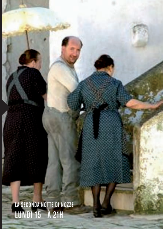
LA SECONDA NOTTE DI NOZZE LUNDI 15 À 21H

Projection unique 3 €. Avec la collaboration du Consulat Général d'Italie.